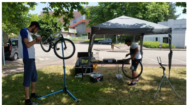
Figure 3: Atelier mobile à la fête de quartier du Val de l'Aurence Nord 18/06/22