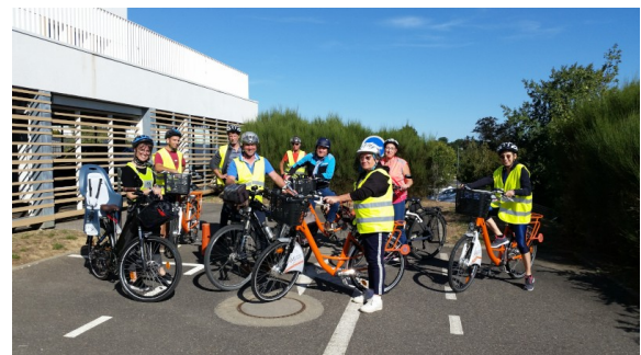
Figure 2: Formation à la conduite du vélo en sécurité Pole Emploi 20/09/2022