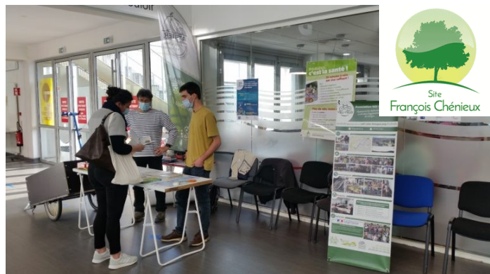
Figure 1: Stand d'information à la Clinique Chénieux le 18/11/2021.